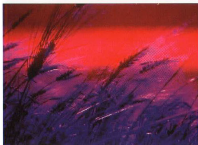
V36. SABRINA MEZZAQUI, «FIORITURA», 2001. VIDEO, COL., SONORO, 10'.